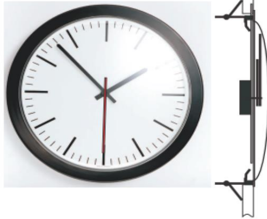
ESTILOS DE CARATULA DE RELOJ.

El reloj tiene para su anclaje una abertura de montaje en la parte trasera, con abrazaderas de resorte.